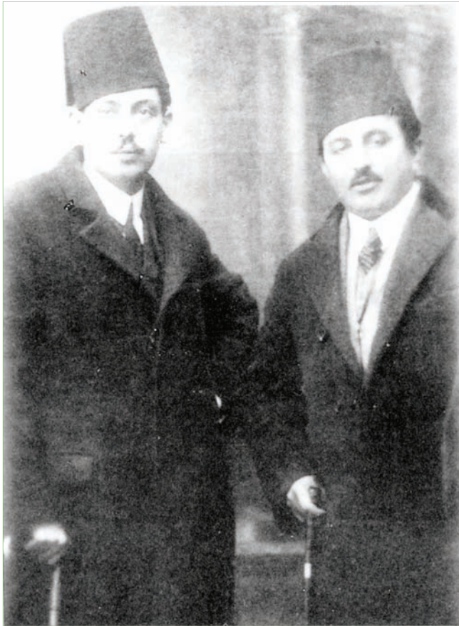
مع امين الريحاني

كان له إشعاعه في العالم العربي إذ دعي إلى إلقاء محاضرة في جامعة الأزهر في مصر ومثّل لبنان في المهرجانات الأدبية العربية.